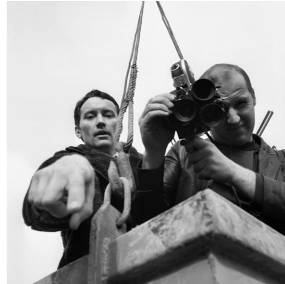
Ein Team des ungarischen Fernsehens MTV auf der Baustelle eines Kraftwerks nahe der Donau 1971