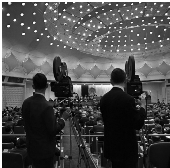
Kameraleute filmen Walter Ulbricht, der dem Präsidium der Volkskammer den Entwurf einer neuen »Sozialistischen Verfassung der DDR« vorlegt, Berlin 31.1.1968.

Die Geschichtswissenschaft war bis weit in das 20. Jahrhundert hinein vor allem eine Textwissenschaft. Erst in den vergangenen Jahrzehnten wurden Bilder zunehmend als Quellen einbezogen und gleichzeitig auch selbst zum Untersuchungsgegenstand. Ziel der Tagung ist es, eine kritische Bestandsaufnahme der Visual History zu leisten, methodische Probleme zu thematisieren, das Gespräch mit Nachbardisziplinen zu suchen und Perspektiven für den Umgang mit Bildern in der Geschichtswissenschaft zu entwickeln.